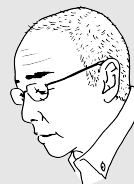
イラスト協力：加藤舞美

今年から受付中心に手伝いをいたしておりますオジイです。皆様、先の猛暑を生き延びてこられたのですね、私、何十年に一度の異常気象と聞くと血が騒ぐのです。そのレア感だけでなく、自然の猛威は人間の小ささ、否、愚かさまでも頭ににするから。そして、自然のみでなく、社会自ら生み出した己の歪、その修復のため、NPOがあるのでしょう。