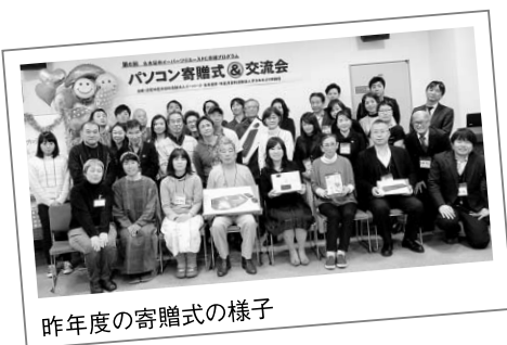
昨年度の寄贈式の様子

情報の整理や管理、チラシやポスターの作成、ホームページやブログ、SNSの更新、プレゼンや講演など、市民活動の様々な場面で大活躍するパソコン。この機会に、団体の情報化に取り組んでみませんか？